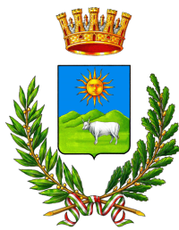
Comune di Nuoro