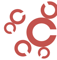
Scuola di Architettura di Cagliari